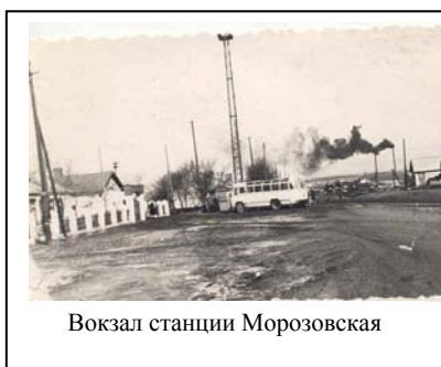
Вокзал станции Морозовская

После земельной реформы 1861 года торговое и земледелие на Дону быстро развивалось.